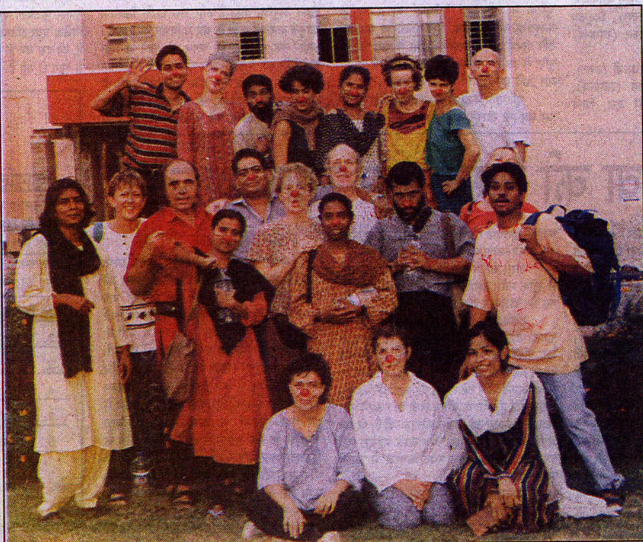
फ्रांसिसी और भारतीय कलाकार 'थियेटर फॉर अप्रेशड' में

इमेज को सपनों में नहीं बदलना होता है, जमीन पर बदलना होता है। दर्शकों में से जो लोग उठकर तस्वीर बदलने आते हैं, उनसे कहा जाता है कि पहले वे उनकी जगह लें फिर बताये कि इस बेजान अमानवीय इमेज को कैसे इन्सानी तस्वीर में, जो उनका अपना सपना है बदल सकते हैं। जयपुर के लोगों ने पहली बार इमेज शैली के नाटक देखे और इसमें हिस्सा भी लिया। खूब मजा आया उन्हें।